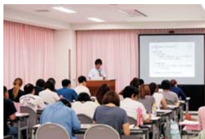
介護職員初任者研修