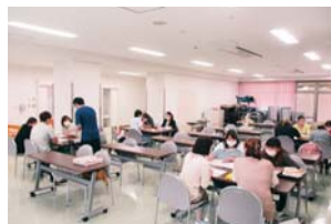
介護福祉士実務者研修