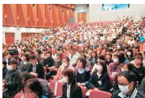
法人内研究発表会