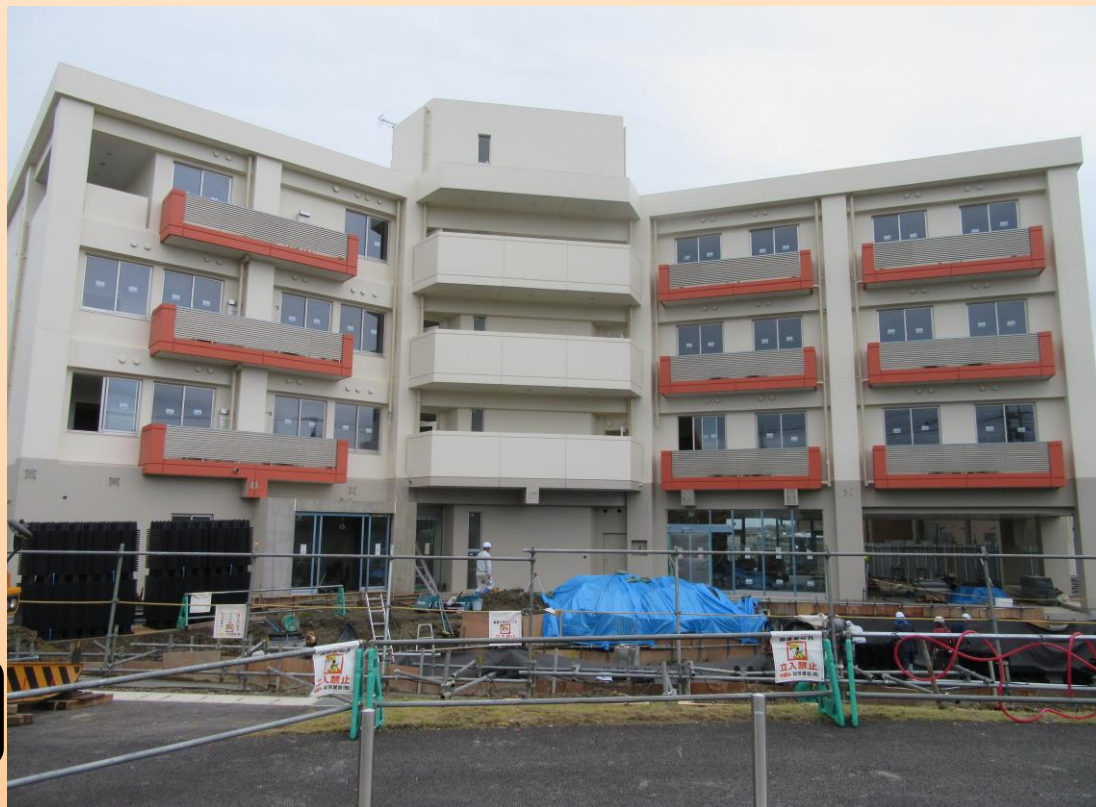
建設中の 聖アンナ館

サービス付き高齢者向け住宅聖アンナ館は、見守りと生活相談サービスを提供し、必要な方にはその他の医療・介護等の支援を行う賃貸住宅です。