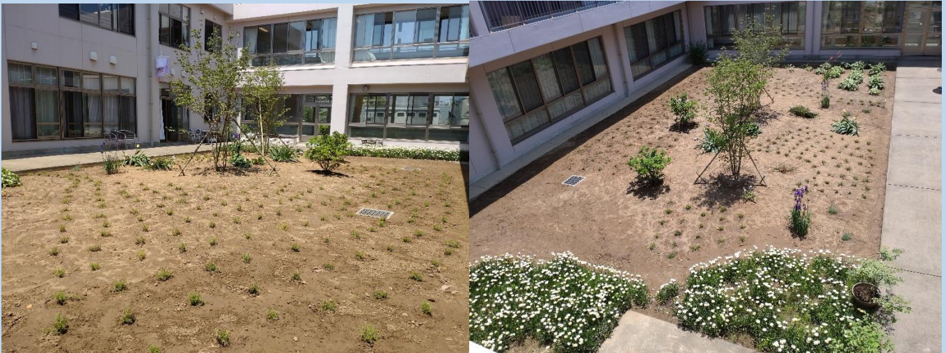
完成了ました。中央にやまぼうしの木、周囲に芝桜を植えました。