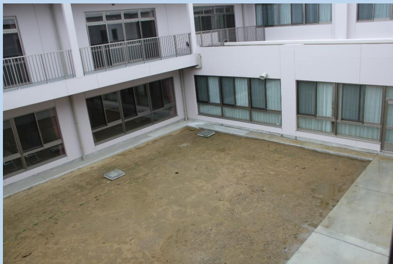
オープン時の中庭

新館の中庭は平成24年の新館オープン以来ボランティアの方が様々な花を植えてくださり季節感を感じさせてくれる場所でした。