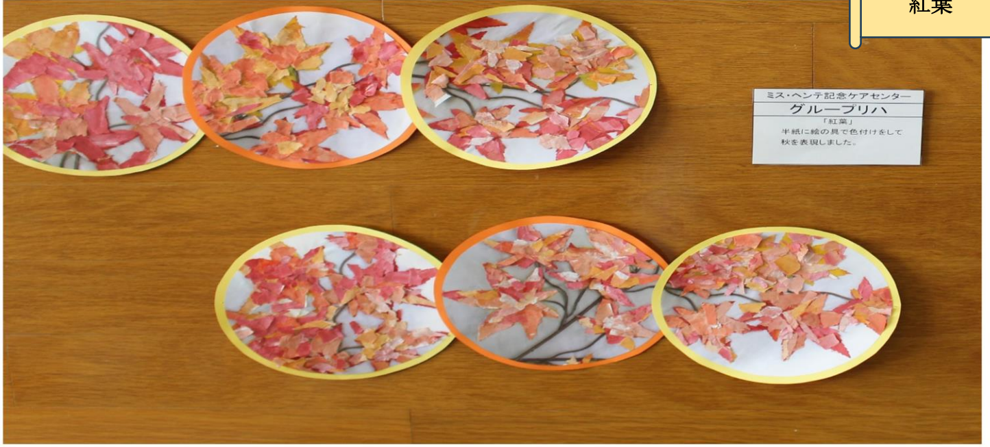
ミス・ヘンテ記念ケアセンター グループリハ 「紅葉」 半紙に絵の具で色付けをして 秋を表現しました。