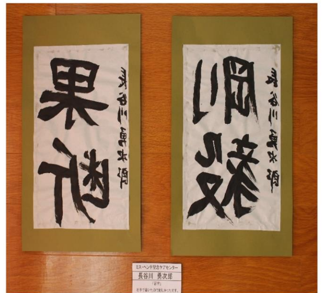
ミス・ヘンテ記念ケアセンター 長谷川 勇次郎 （名字） 左手で書いたものを映して